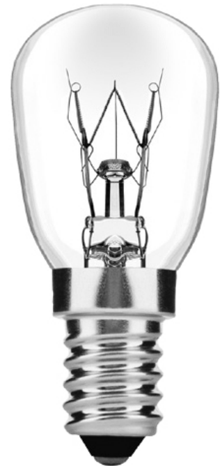
ABBILDUNG DES PRODUKTS