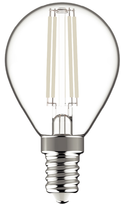
ABBILDUNG DES PRODUKTS